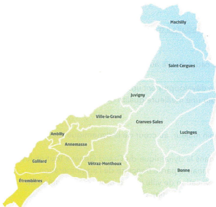
Annemasse dans la structure du S.Co.T.