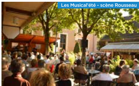
Les Musical'été - scène Rousseau