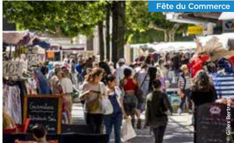
Fête du Commerce