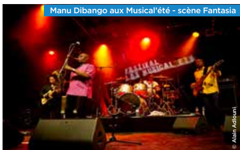
Manu Dibango aux Musical'été - scène Fantasia