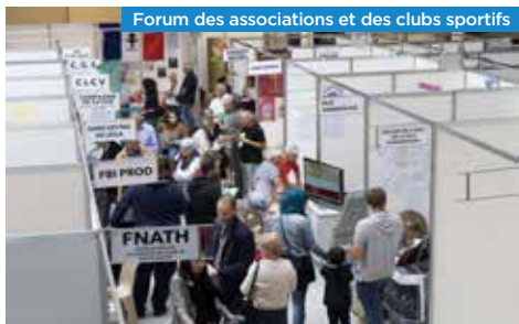
Forum des associations et des clubs sportifs